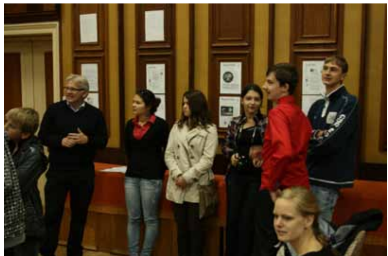
Fra besøget i Rumænien.